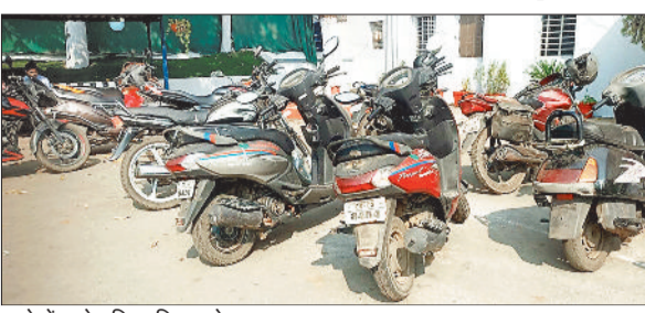
थाने में खड़े पुलिस विभाग के वाहन।

पुलिस के अधिकारियों को अपराधियों की धरपकड़ से लेकर और दीगर काम निपटाने के लिए शासन द्वारा चार पहिया वाहन उपलब्ध कराया जाता है तो वहीं