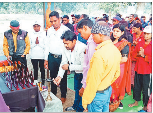
शिविर में उपस्थित वार्डवासी।