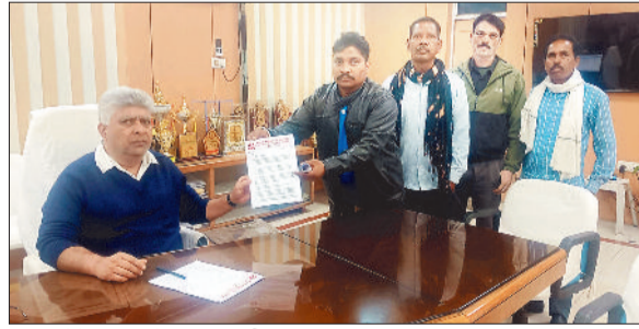
ज्ञापन देते माकपा के पदाधिकारी।