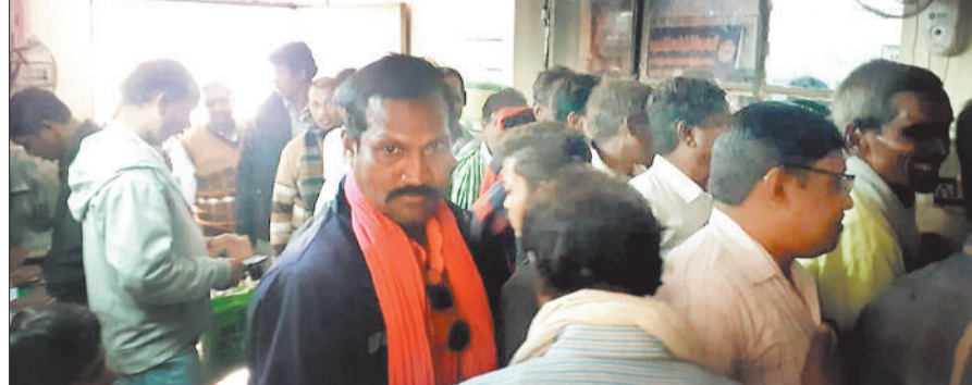
जिला सहकारी बैंक की कोरबा शाखा में लगी किसानों की भीड़।

धान खरीदी और बोनस का पैसा एक साथ ले रहे किसान